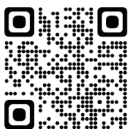
ホームページ QRコード

https://tsukechi-craft.jimdofree.com/ https://www.instagram.com/tsukechi_craft/ https://tsukechicraft.blog.fc2.com/