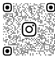
TSUKECHI_CRAFT Instagram QRコード